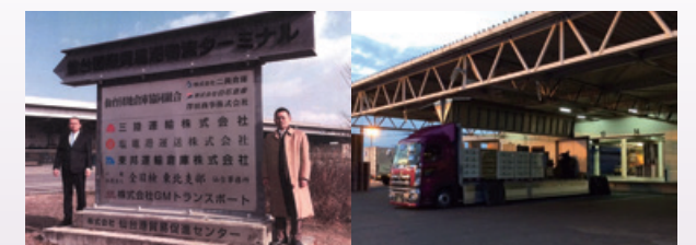
●社名変更した当初の記念写真(左)と配送トラック一号(右)

そんな中、私は一つの大きな決断を致しました。 (株) GM トランスポートと社名を変更し、土砂運搬ダンプから一般貨物輸送トラックに変更し、業務内容を物流事業に切り替える事です。