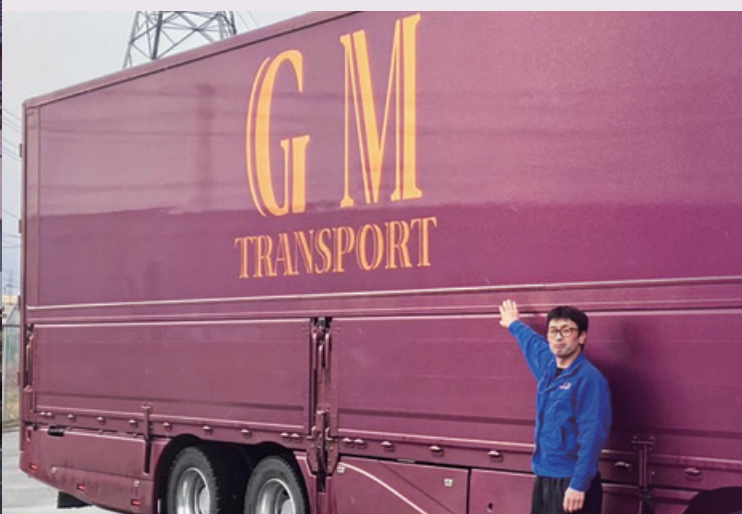
●現在は物流を中心に一般貨物運送や海上コンテナ運送をおこなっています

その結果、貨物トラックの購入で背負うものは増えましたが、経営は好転させる事が出来たのです。 復興事業について継続出来なかった事は残念な気持ちが残りますが、その当時も、現在も、取引頂いているお客様には感謝しかありません。 私達が運ぶ荷物の行き先を考えれば、新たな形で「地域貢献」が出来ているのではないかと感じています。 社員には「家族を大事にする事」をお願いし、働きやすい環境作りに努め、大好きな車と共に、社員一丸となり「地域貢献」し続けて参りたいと思います。