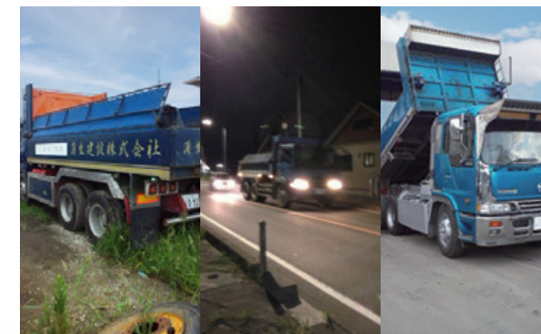
●蒲生建設(株)では土木資材運搬をおこなっていました

土砂は、津波浸水地域のかさ上げや宅地造成に利用されました。 日々少しずつ変わっていく各地の街並みを見て、生まれ故郷である石巻市の惨状と復旧にも思いを馳せながら、とてもやりがいのあるものでした。 しかし円安による燃料価格の上昇、同業他社との価格競争は激化の一途をたどりました。 自身の報酬はゼロ、社員を減らす事を余儀なくされ、憤りを感じ、苦境に立たされた時期もございました。